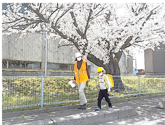
満開の桜の下で 下校指導