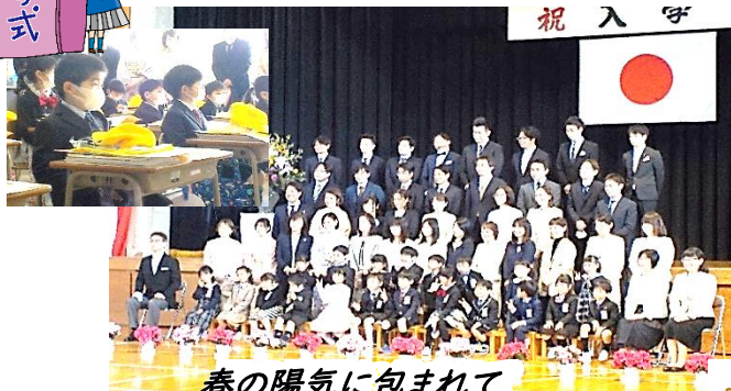
春の陽気に包まれて 20名の新一年生を迎えました。

新潟市では、学校教育活動のさらなる充実と豊かなコミュニティづくりを目指して、地域に開かれ共に歩むことができるよう『地域と学校パートナーシップ事業』の推進に努めています。